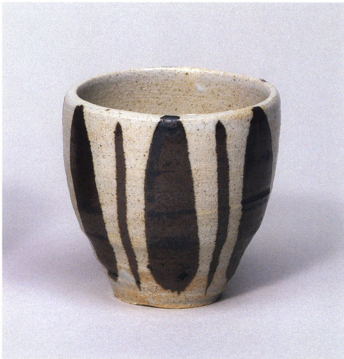
48 高松宮妃喜久子殿下 鉄絵白釉湯呑茶碗 三峰窯 昭和三十一年 径七・四、高台径三・六、高七・三